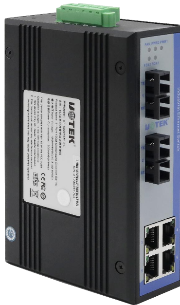
UT-62204系列 6口百兆非网管型以太网交换机